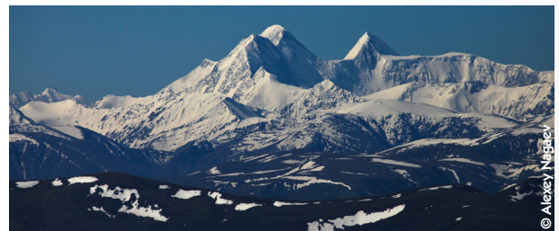
Vue de la montagne Belukha depuis le Nord. Les carottes de glace seront prélevées dans la cuvette située entre les deux sommets.

L'opération de forage du glacier Belukha commencera aux alentours du 20 mai 2018. Le matériel de forage a été transporté par bateau depuis la Suisse jusqu'à Barnaul en Sibérie, et sera transporté avec l'équipe de scientifiques jusqu'au glacier en hélicoptère.