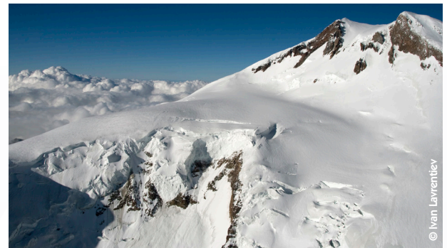
Site de forage sur le plateau Ouest de l'Elbrouz (5 100 m).

Le forage et l'analyse des carottes de l'Elbrouz sont des opérations soutenues par la Fondation Russe pour la Science (projet 17-17-01270) et par le projet ICE MEMORY . L'expédition est soutenue par l'Institut de Géographie de l'Académie des Sciences de Russie, qui célèbre son centième anniversaire en 2018. Pour célébrer ce jubilé, une conférence scientifique internationale se tiendra à Moscou en juin et rassemblera des chercheurs et géographes mondiaux de haut niveau.