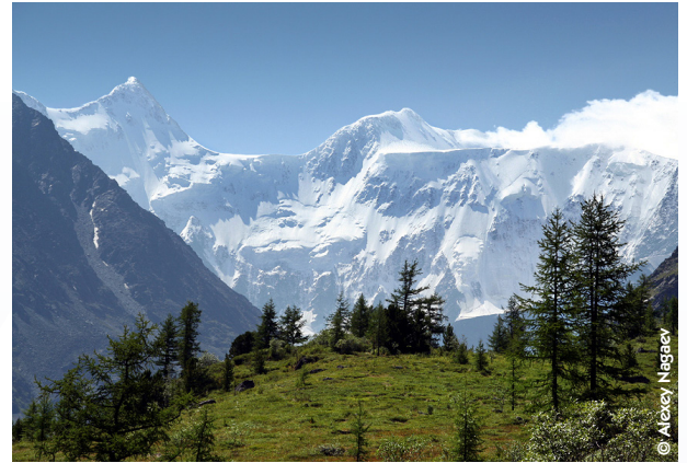
Face Nord du Belukha depuis le camp de base Ak-kem.

Les résultats de la première expédition de forage (2009) ont montré que les carottes de glace provenant de l'Elbrouz pouvaient fournir des informations uniques sur plusieurs aspects clés des changements environnementaux, de la pollution de l'air et de l'activité volcanique.