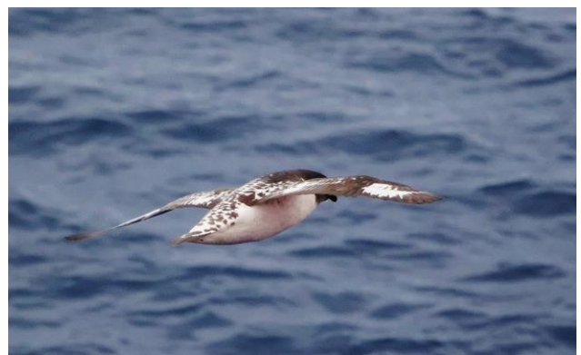
Damier du Cap