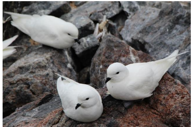
Pétrel des neiges