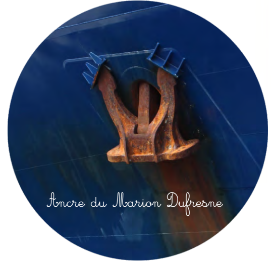
Ancre du Marion Dufresne

Les ancres permettent de maintenir le bateau autour d'une position. Le Marion Dufresne en possède deux. Devant l'îlot de Tromelin, nous ne les utilisons pas, même si nous restons 2 jours sur place, afin de ne pas risquer d'abîmer les fonds marins coralliens qui entourent l'îlot.