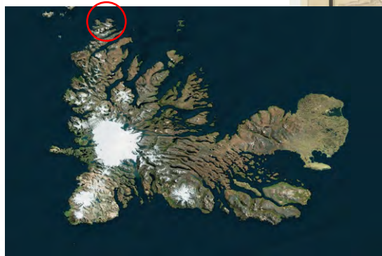
Baie de l'Oiseau Port Christmas