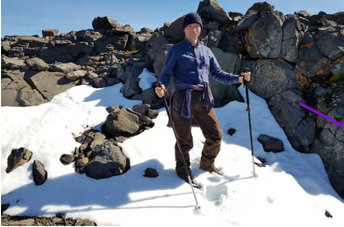
Névés vers 600 m.

Cette image en 3D, est une interprétation de l'occupation sur sol observée à partir des satellites Sentinel 2. En vert se trouve la végétation et en rouge les déserts de roches.